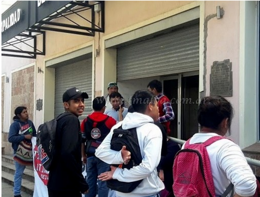
Originarios en reclamo , Marzo de 2020